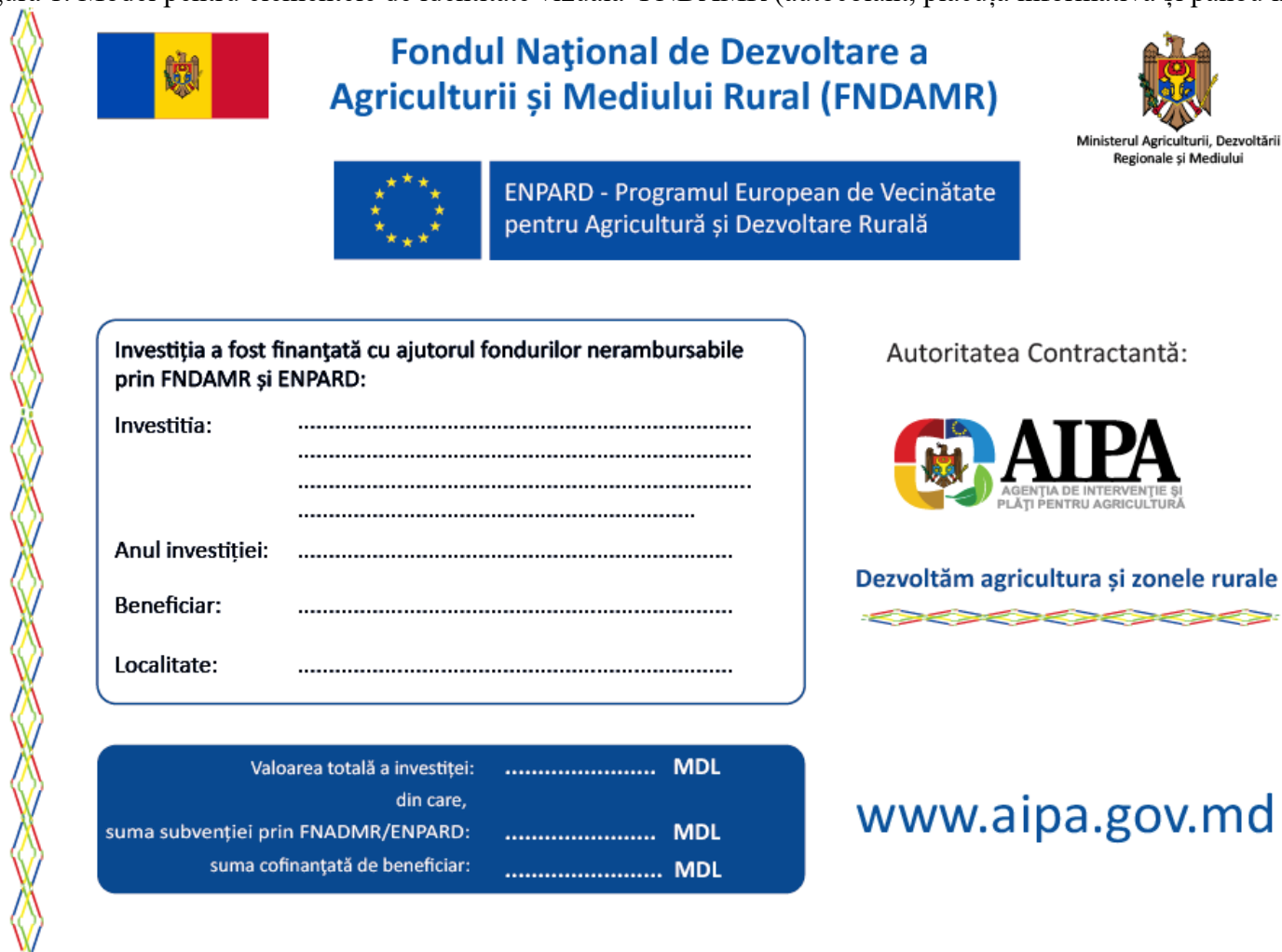
Figura 1. Model pentru elementele de identitate vizuală FNDAMR (autocolant, plăcuță informativă și panou informativ)